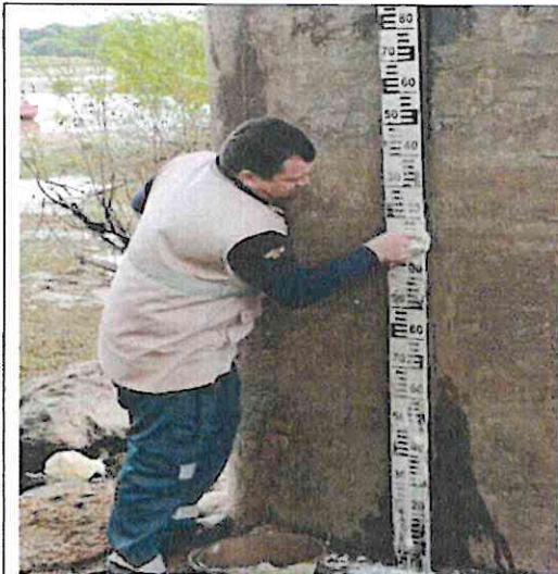
Limpieza de incrustaciones