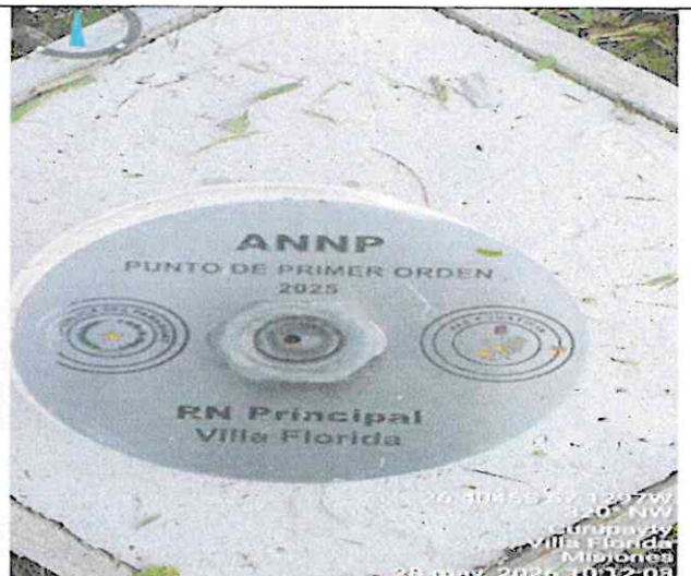
Registro fotográfico y georreferenciación del sitio.