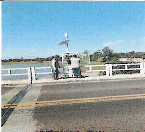
Descarga de información: